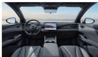
Noir / Bleu