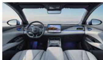
Gris Perle / Noir